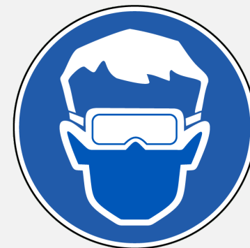
Proteção ocular e sinal para utilização de proteção ocular