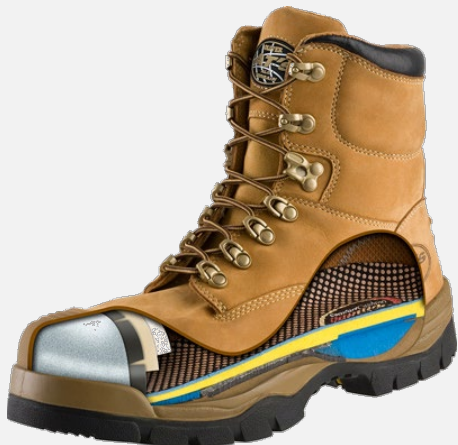
Sapatos de segurança (reforço dos dedos)