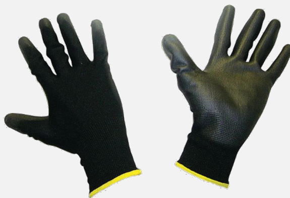
Luvas de proteção