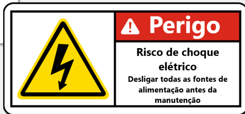
Etiqueta de risco de choque elétrico