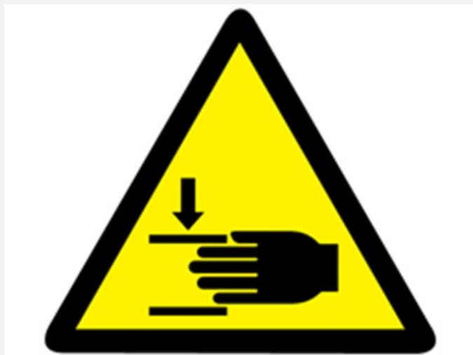
Simbolo de perigo de enclausramento dos dedos