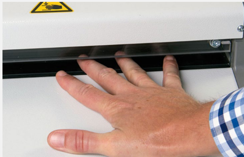
Exemplo do risco